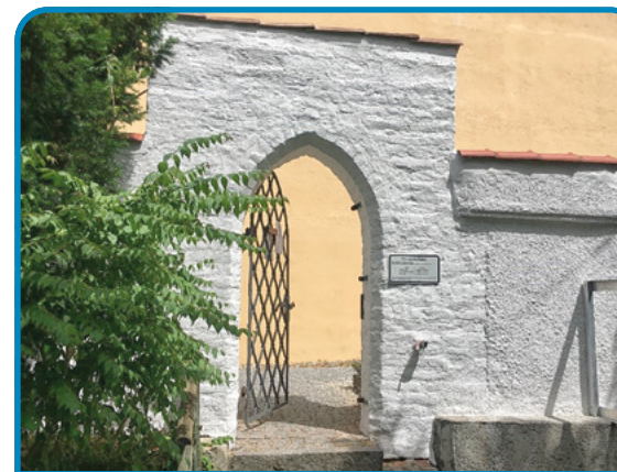
Durch die Sanierungs-Arbeiten erstrahlt der Friedhof Walleshausen wieder in neuem Glanz.

Die Kosten dieser Nachtragsarbeiten belaufen sich auf 9.440,33 €, die dafür beantragten Zuschussanträge wurden bereits bewilligt.