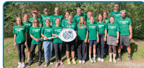
▶ Viele Betreuer kümmerten sich um den Verlauf des Tenniscamps.