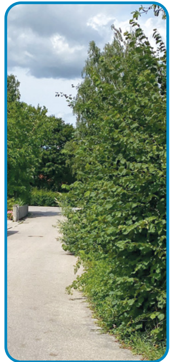
Bild rechts: Wenn die Hecke zu weit in die Straße hineinreicht, ist die Verkehrssicherheit gefährdet.

Deshalb der Appell an Sie: Bitte kontrollieren Sie in regelmäßigen Abständen, ob Anpassungen an Pflanzungen auf Ihrer Grundstücksgrenze erfolgen müssen. Diese Rücksicht auf andere erspart uns – aber auch Ihnen – unnötige Verwaltungsarbeiten.