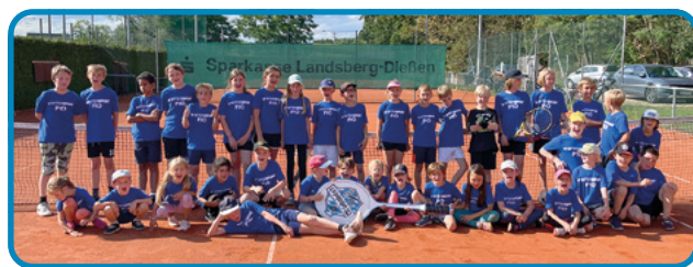
▲ Die Teilnehmer des Tenniscamps.

Die Zukunft dieser beiden Truppen ist daher zweifellos vielversprechend – beide Mannschaften sind fest entschlossen, die Herausforderungen der kommenden Saison anzunehmen und das hohe Spielniveau aufrechtzuerhalten. Kommt's einfach vorbei und schaut's uns zu – wir freuen uns über Fans am Platz!