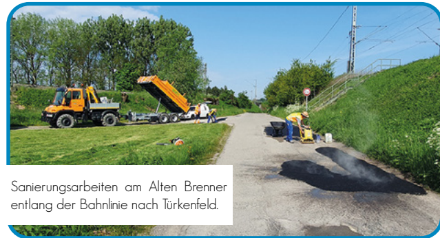
Sanierungsarbeiten am Alten Brenner entlang der Bahnlinie nach Türkenfeld.

Zu Straßenschäden kommt es häufig durch den Wechsel von Minus- zu Plusgraden und umgekehrt. Dadurch tritt der sogenannte „Wasser-Eis-Schlagloch-Effekt“ besonders oft auf. Durch Risse im Asphalt dringt Wasser ein und sammelt sich unter der Fahrbahndecke. Das zu Eis gefrierende Wasser dehnt sich aus. Die Fahrbahndecke hebt sich – es entstehen neue Risse. Das Eis schmilzt, wassergefüllte, brüchige Hohlräume bleiben zurück.