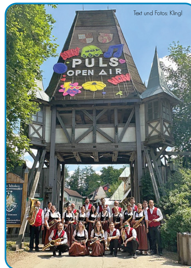
Text und Fotos: Klingl

Weitere Infos: www.blasorchester-geltendorf.de