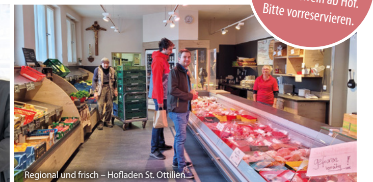
Regional und frisch – Hofladen St. Ottilien