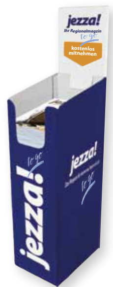
Weithin sichtbarer jezza!-Aufsteller in vielen Geschäften

Gerne beraten wir Sie persönlich bei der Gestaltung und Form Ihrer Anzeige, damit Ihr individueller Auftritt im Heft optimal gelingt! Denn auch in puncto Anzeigen überlassen wir nichts dem Zufall: erstklassiger Service, bestmögliche Qualität und individuelle Beratung – dafür steht jezza!