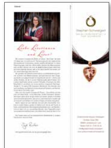
Beispiel Anzeige 1/3 Seite hoch, Exklusivplatzierung neben Editorial