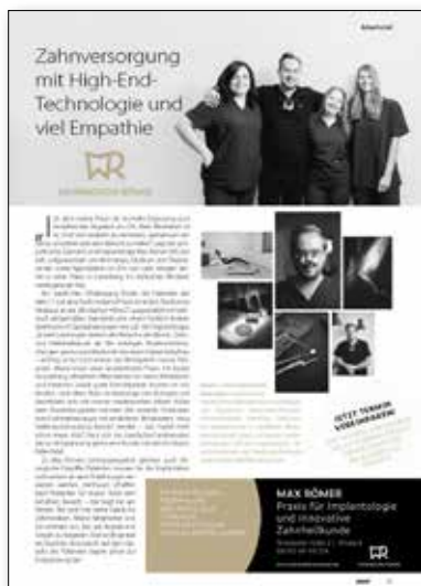
Beispiele für ganzseitige Firmenportraits